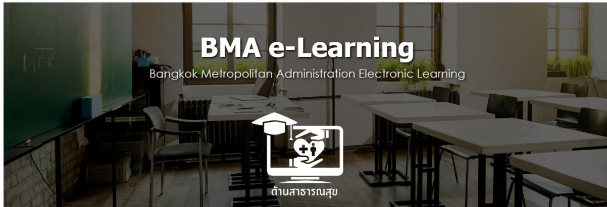
(ภาพประกอบ1.2: ขั้นตอนการสมัครสมาชิกและการยืนยันตัวตน)